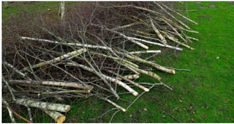
Foto van de maand 'winteronderhoud'